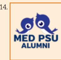
นายกสโมสรนักศึกษาแพทย์ (กรรมการ)