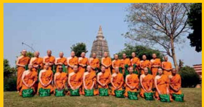
พระมหาโพธิเจดีย์ พุทธคยา