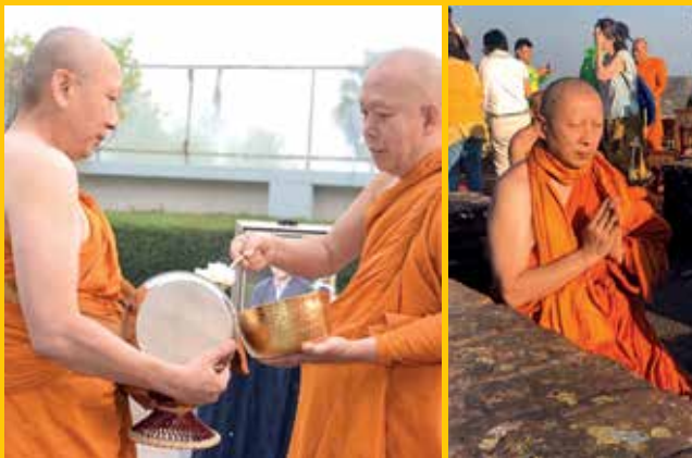
ทำวัตรเย็นเจริญพระพุทธมนต์ เจริญจิตภาวนา ณ มูลคันธกุฎี ซึ่งเป็นกุฏิของพระพุทธเจ้าบนยอดเขาคิชฌกุฎ

ได้กลับมาปฏิบัติธรรมต่อที่วัดพระพุทธแสงธรรม จังหวัดสระบุรี โดยฝึกปฏิบัติธรรม สวดมนต์ ฟังสมาธิ และเดินจงกรม