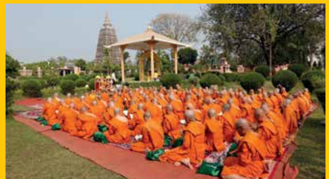
ทำวัตรเช้า วัตรเย็น สวดมนต์ภาวนา ที่พุทธคยา

พิธีบรรพชาอุปสมบท ได้กระทำ ณ เขตพัทธสีมา อุโบสถวัดป่าพุทธคยา หลังจากนั้นได้มีการปฏิบัติธรรมและเจริญพระพุทธมนต์ ณ วัดมหาโพธิมหาวิหาร สถานที่ตรัสรู้และสักการะต้นพระศรีมหาโพธิ์ ต้นไม้แห่งการตรัสรู้ที่พระโอรสัดว์เจ้าชายสิทธัตถะประทับนั่งบำเพ็ญเพียร จนบรรลุอนุตรสัมมาสัมโพธิญาณเป็นพระพุทธเจ้า ตลอด 4 วัน ที่พุทธคยาจะมีการทำวัตรเช้า วัตรเย็น สวดมนต์ภาวนา นั่งสมาธิ และเวียนเทียนรอบพระมหาโพธิเจดีย์ทุกวัน และบูชาพระพุทธเมตตา พระพุทธรูปองค์ประธาน ในพระมหาโพธิเจดีย์ที่มีอายุกว่า 1,400 ปี ได้เยี่ยมชมสัตตมหาสถาน สถานที่ทั้ง 7 ที่ พุทธเจ้าทรงประทับเสวยวิมุตติสุข (สุขแห่งการหลุดพ้น) ตลอด 7 สัปดาห์หลังการตรัสรู้ และได้เดินทางไปเยี่ยมชมสถูปสุชาดาภูมิ สถานที่เคยเป็นที่ตั้งของบ้านนางสุชาดา ธิดาของคหบดีผู้มั่งคั่งแห่งตำบลอุรุเวลาเสนานิคม ผู้เป็นมหาอุบาสิกาคนสำคัญที่ได้ถวายข้าวมธุปายาส ซึ่งเป็นอาหารมื้อสำคัญก่อนที่พระโอรสัดว์ เจ้าชายสิทธัตถะได้ประทับบำเพ็ญเพียรจนได้ตรัสรู้เป็นพระพุทธเจ้า และได้เดินทางไปเยี่ยมชมและนมัสการวัดนานาชาติต่าง ๆ เช่น วัดญี่ปุ่น วัดภูฐาน เป็นต้น ซึ่งเป็นพุทธสถานนานาชาติ ที่สร้างจากแรงศรัทธาของพุทธศาสนิกชนทั่วโลก