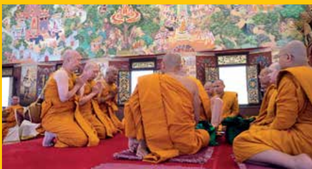
พิธีบรรพชาอุปสมบท ณ เขตพัทธสีมา อุโบสถวัดป่าพุทธคยา