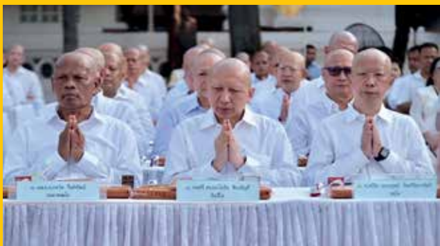
พิธีโกนผมนาค ซึ่งจัดบริเวณสวนข้างพระอุโบสถวัดเทพศิรินทร์

พิธีโกนผมนาค จัดขึ้นที่บริเวณสวนข้างพระอุโบสถวัดเทพศิรินทร์ 1 วันก่อนจะเดินทางไปทำพิธีบรรพชาอุปสมบทที่พุทธคยา