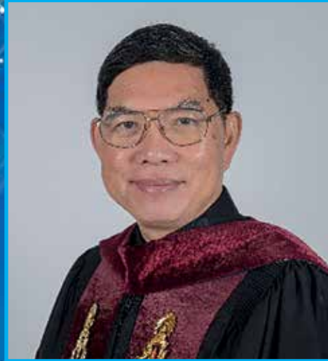
ศ.นพ.พิเชฐ อุดมรัตน์