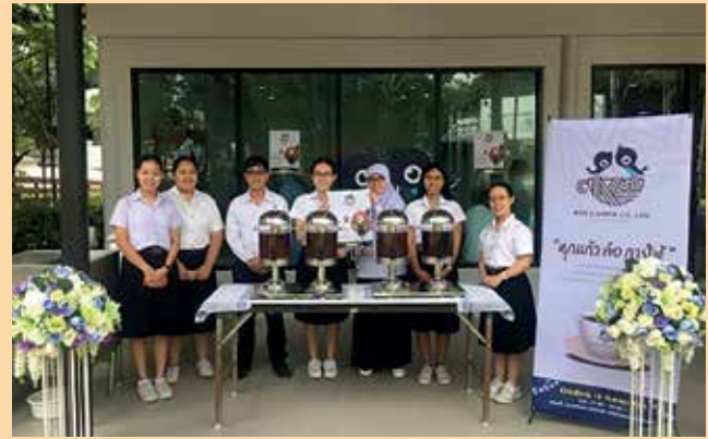
น้อง ๆ นักศึกษาแพทย์ ดูแลฟี่ ๆ บัณฑิตในวันรับปริญญา อีกหนึ่งโปรโมชันดี ๆ สำหรับบัณฑิตทุกคนะ “เชคอิน กินฟรี” กับร้าน Binla Brew