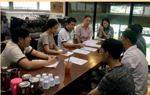
สัมภาษณ์บาร์ิสต้า