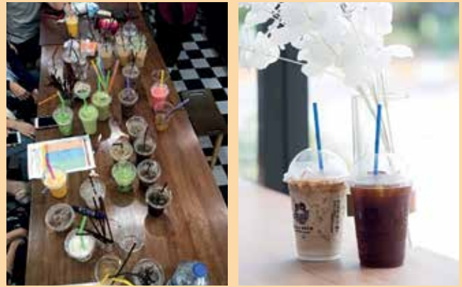
ทดสอบเครื่องดื่ม