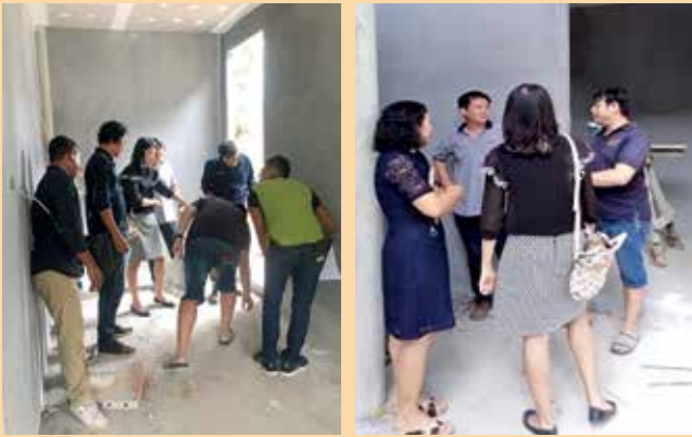
กรรมการสมาคมฯ และกรรมการบริหารร้าน Binla Brew ดูพื้นที่ก่อสร้างและปรับเปลี่ยนโครงสร้างภายในร้าน