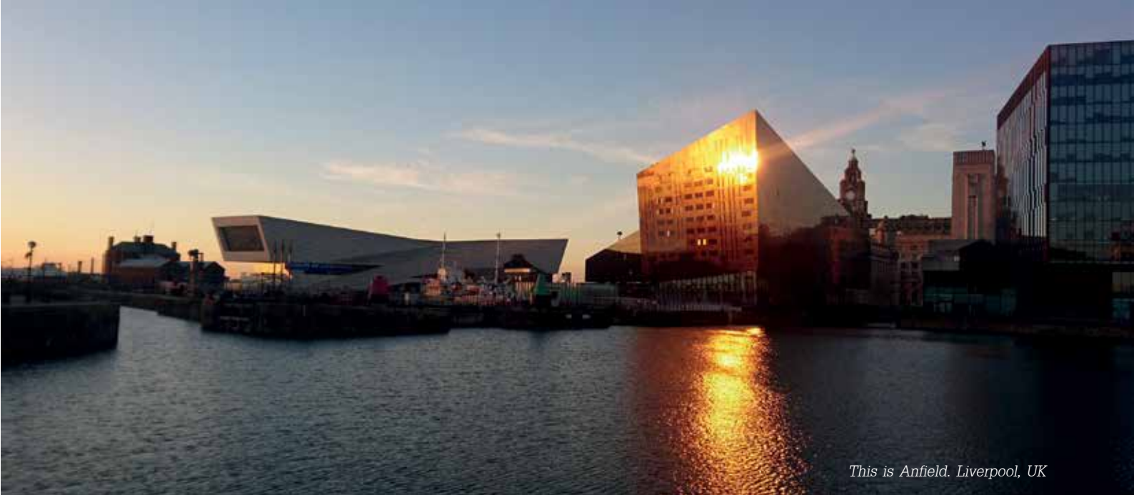
This is Anfield. Liverpool, UK

ชีวิตความเป็นอยู่ที่เมืองลิเวอร์พูลถือว่าดีมากครับ (ถ้าไม่นับอากาศหนาวที่ 0-5 องศาเซลเซียสเกือบตลอดฤดูหนาวที่ผ่านมา) บริเวณมหาวิทยาลัยจะอยู่ใกล้ย่านการค้า ย่านร้านอาหาร และย่านท่องเที่ยวของเมือง สามารถเดินไปมาทั่วถึงภายใน 15-20 นาที สถานที่ท่องเที่ยวที่สำคัญของเมือง (นอกจากแอนฟิลด์อันยิ่งใหญ่เกรียงไกรแล้ว) ก็มีย่านริมน้ำ Merseyside (Liverpool Waterfront) โดยเฉพาะอู่เรือ Albert dock ซึ่งประกอบด้วยกลุ่มอาคารและท่าเรือที่เป็นหัวใจ การเดินเรือนับตั้งแต่สมัยล่าอาณานิคม การเดินเรือไปยังทวีปอเมริกา การค้าทาส การปฏิวัติอุตสาหกรรม เรื่อยมาจนถึงสมัยสงครามโลก เมืองลิเวอร์พูลมีบทบาทสำคัญในประวัติศาสตร์โลกหลายฉาก และในปัจจุบันบริเวณนี้ประกอบด้วยร้านอาหาร โรงแรม และพิพิธภัณฑ์สำคัญ ๆ เช่น The Beatles Story, Merseyside Maritime Museum, International Slavery Museum นอกจากนี้ บริเวณนี้ยังมีทิวทัศน์ที่สวยงาม เหมาะอย่างมากสำหรับการเดินพักผ่อนหย่อนใจ ชมพระอาทิตย์ตก และเดินเล่น Pokemon Go ครับ