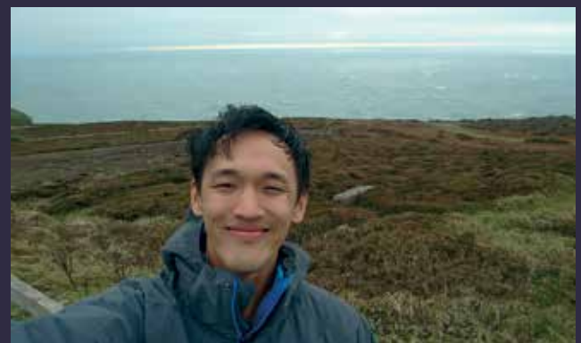
Ynys Lawd South Stack, Wales, UK