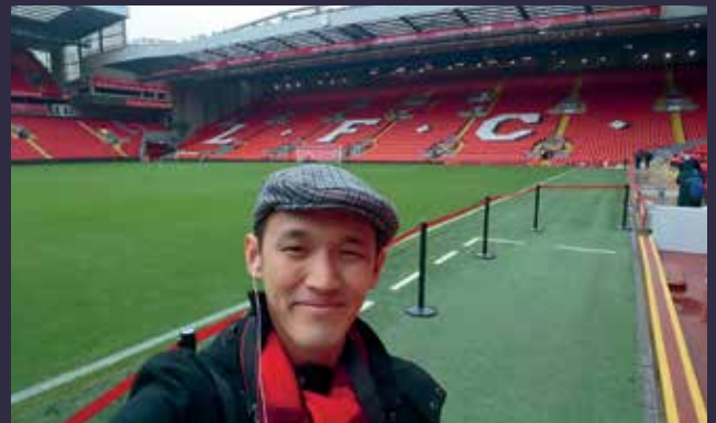
Liverpool Waterfront, Liverpool, UK

การท่องเที่ยวประเทศอื่น ๆ ในโซนยุโรปนั้น ตอนนี้ผมยังไม่ได้วางแผนครับ แต่ก็ได้มีโอกาสไปเที่ยวเมืองอื่น ๆ ในสหราชอาณาจักรบ้าง เช่น เมืองเอдинเบอระ และที่แคว้นเวลส์ ผมตั้งใจว่ารอให้งานในโปรเจกต์ปริญญาเอกทำจนอยู่ตัวถึงระดับหนึ่งก่อน ไม่ได้รีบเที่ยวมากเพราะยังมีเวลาเรียนอยู่ที่นี้อีกพอสมควรครับ และท้ายที่สุด อยากฝากถึงศิษย์เก่าทุกท่านว่า ไม่ว่าจะอยู่ที่ใดในโลกนี้ การระลึกถึงความทรงจำดี ๆ ที่บ้านสงขลานครินทร์ย่อมชวนให้อบอุ่นอยู่เสมอครับ.