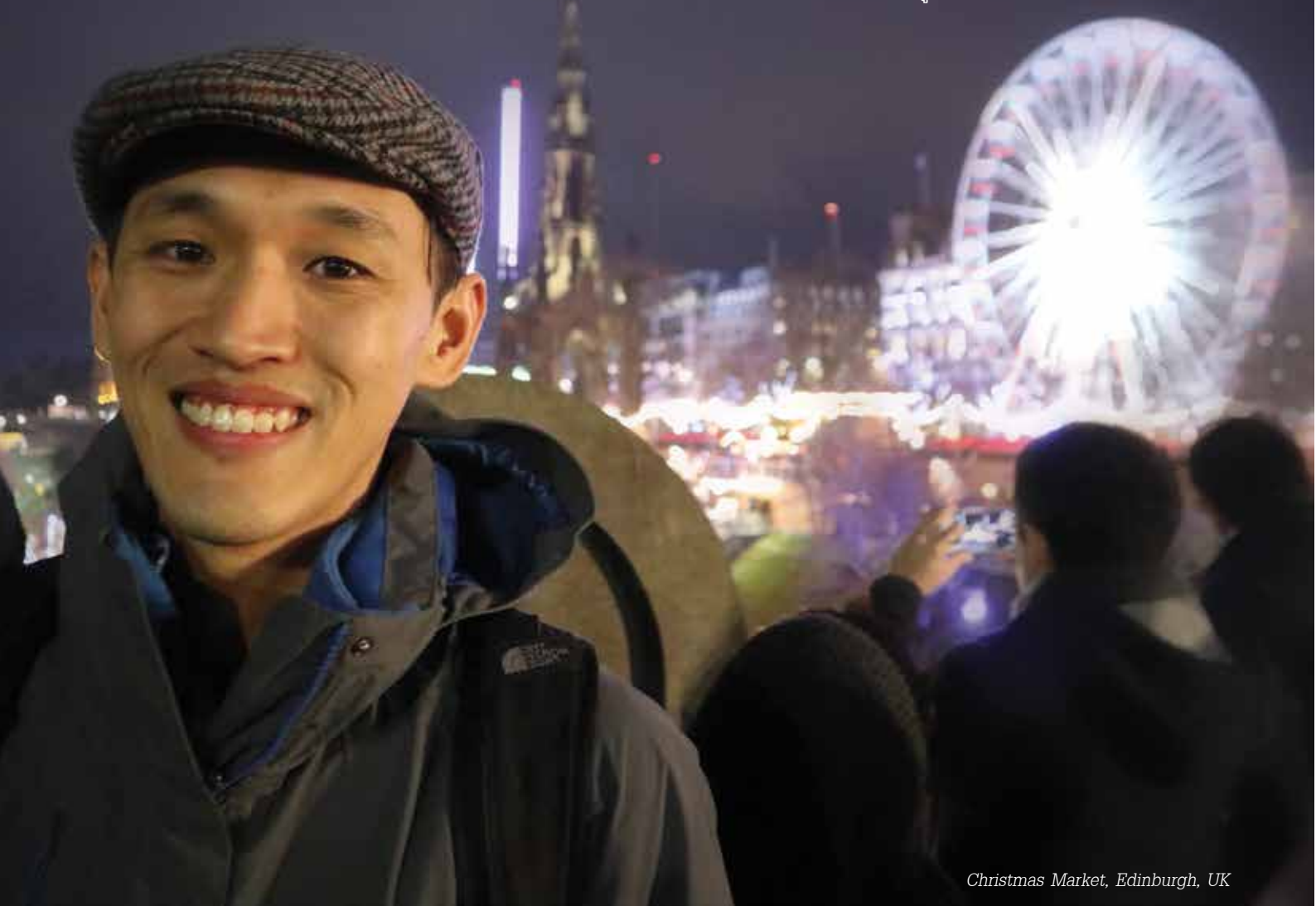
Christmas Market, Edinburgh, UK